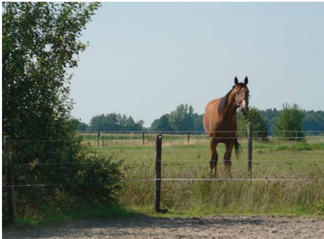
Virgill Boko kijkt nieuwsgierig over de omheining naar zijn bezoek.

voeding heel belangrijk. Daar heb ik heel lang op gestudeerd, maar nu weet ik hoe de juiste voeding eruit ziet. Ik maak dat allemaal zelf. Een nadeel daarvan is het kostenplaatje, maar als mijn paarden er gelukkig van worden, dan ben ik dat ook. Als je goed voert, dan hoef je helemaal niet zoveel vitaminepreparaten te geven. In goed voer moet alles zitten en daarbij is het juiste hooi ook heel