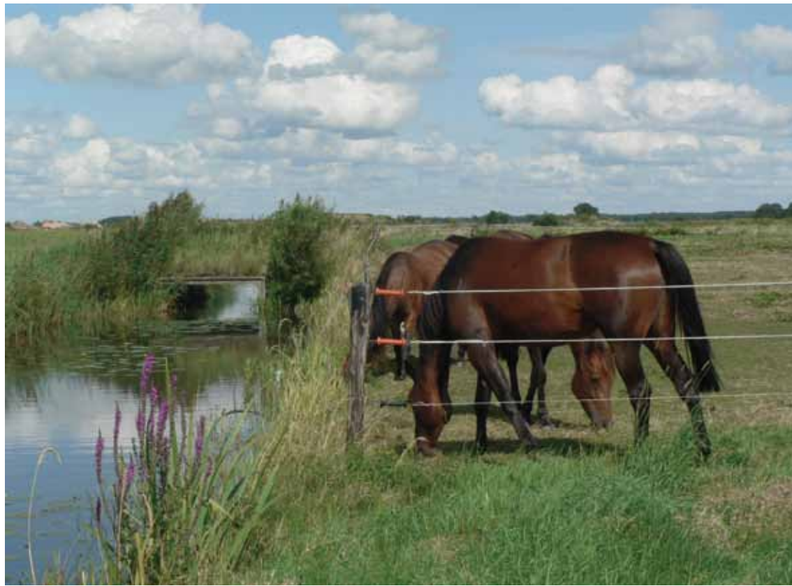
De stal van Prakken, langs het riviertje de Tjonger, is voor de paarden een paradijs op aarde.

"In mijn visie gebeurt er tijdens de dracht en de opfok ontzettend veel en daarbij is goede