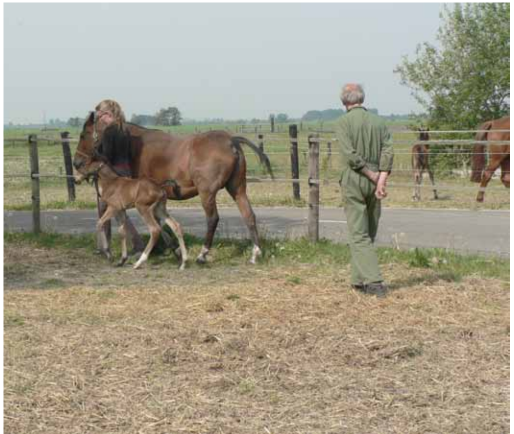
"Aan de ogen van een paard kan ik heel veel aflezen. Ik wil karakter en talent zien."